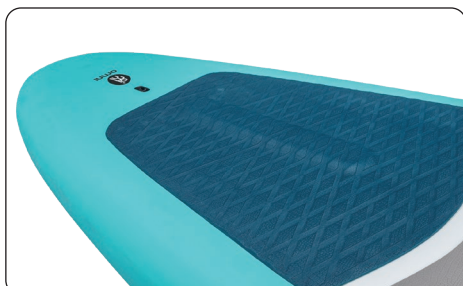
Thermoformed pad with arch bar tail pad