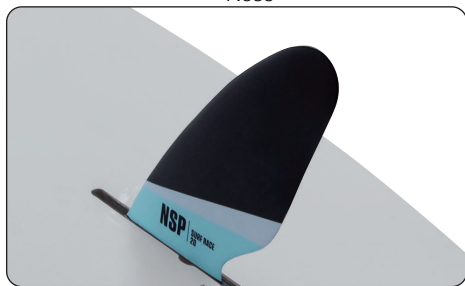
10" Center fin box Surf race 20 fin