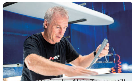
Design by Alain Teurquetill