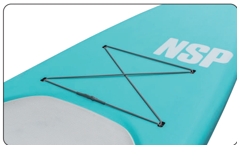
Bungee cord for cargo