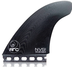
Taylor Knox Twin