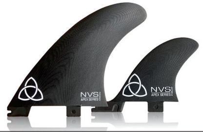
Kraken Twins + Stabilizer