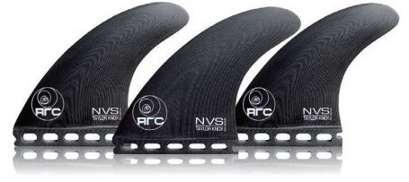
Taylor Knox Thrusters Medium / Large