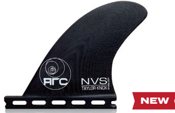
Taylor Knox Stabilizer