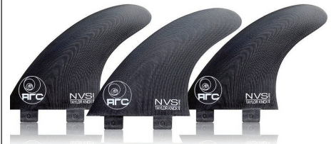
Taylor Knox Thrusters Medium / Large