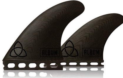
Album Quad, Large