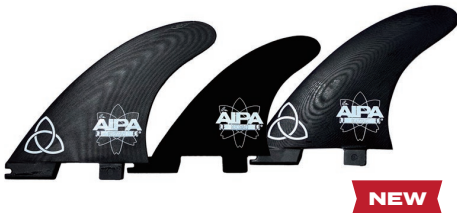
Aipa Da Hook 5-fin