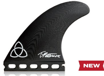
Timmy Patterson Thruster Medium / Large