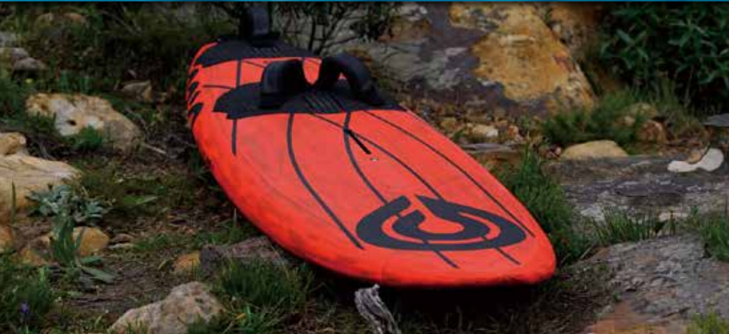
Board : Custom Thruster 5 Pro Carbon Sail : Banzai 12 Pro

All-Around Performance Wave. Frontside to Onshore