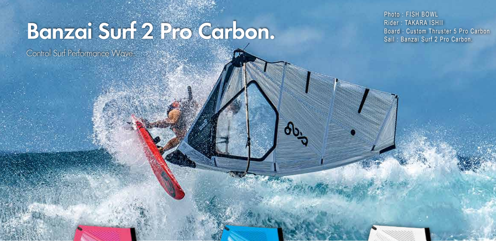
Photo : FISH BOWL Rider : TAKARA ISHII Board : Custom Thruster 5 Pro Carbon Sail : Banzai Surf 2 Pro Carbon.