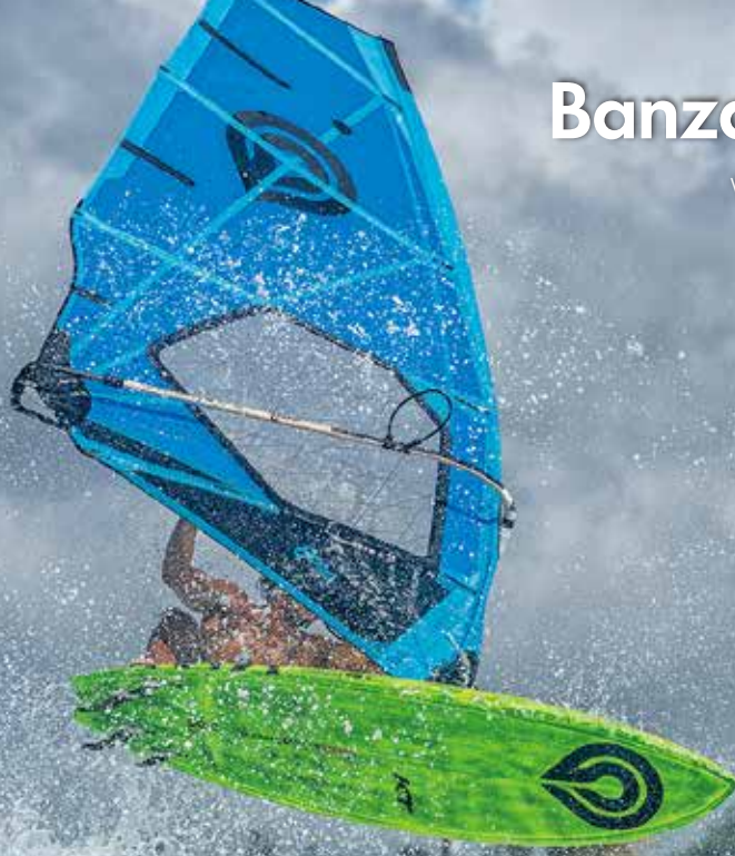
Photo : FISH BOWL Board : Custom Quad 9 Pro Carbon Sail : Banzai 12 X Pro