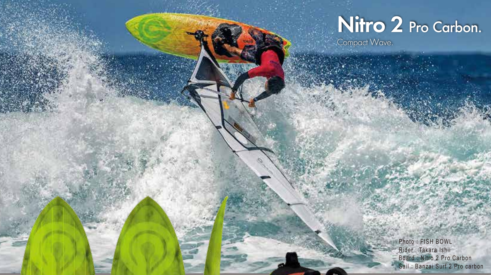
Photo : FISH BOWL Rider : Takara Ishii Board : Nitro 2 Pro Carbon Sail : Banzai Surf 2 Pro carbon