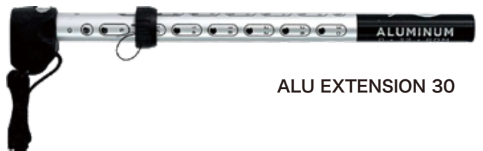
ALU EXTENSION 30