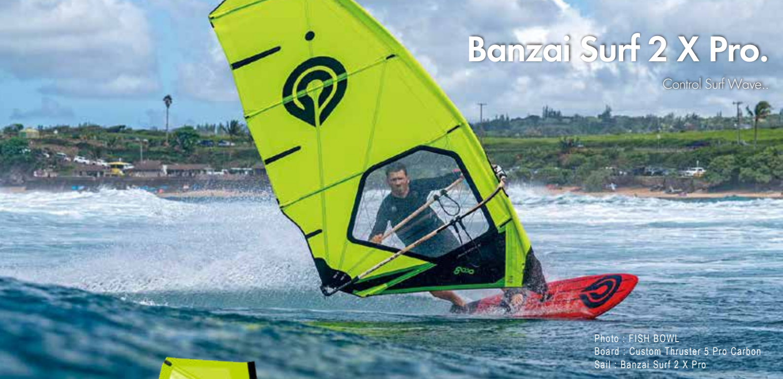
Board : Custom Thruster 5 Pro Carbon Sail : Banzai Surf 2 X Pro