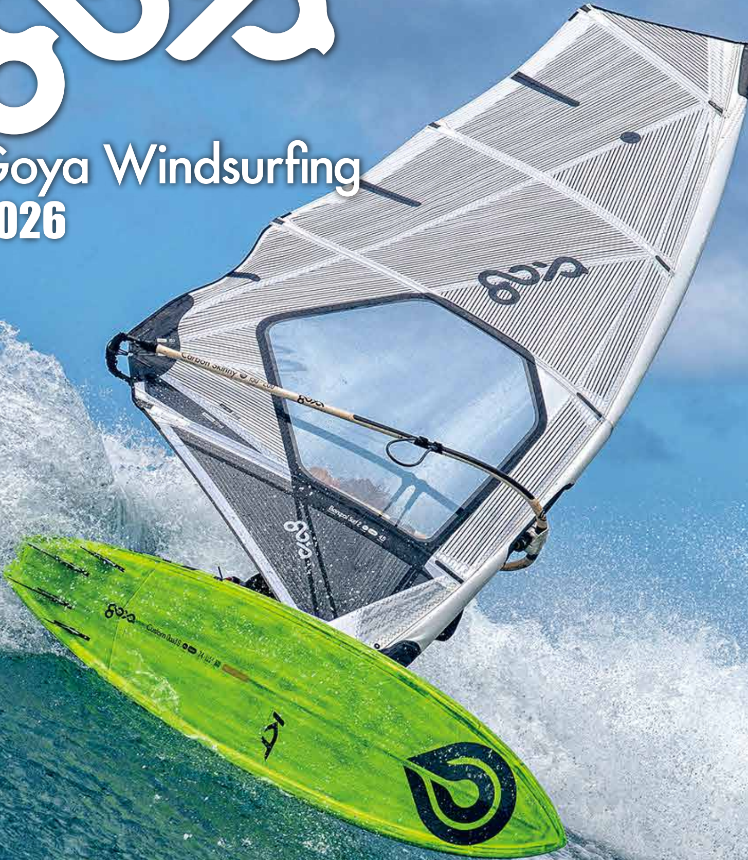
Rider : TAKARA ISHII Board : Custom Quad 9 Pro Carbon Sail : Banzai Surf 2 Pro Carbon.